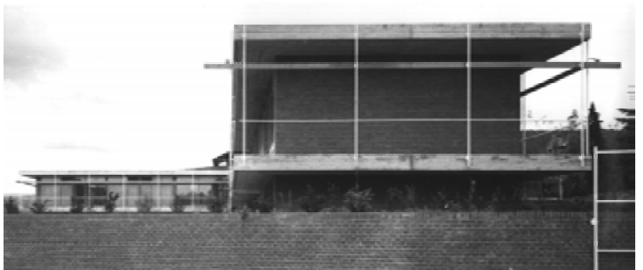
Ansicht Abbildung aus Egon Eiermann 1904-1970, Bauten und Projekte, Stuttgart 1984