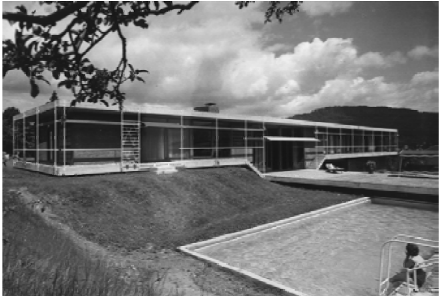
Ansicht, Abbildung aus Egon Eiermann 1904-1970, Bauten und Projekte, Stuttgart 1984