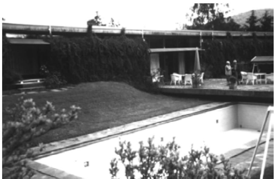
Details, Fotos des Verfassers, heutiger Zustand